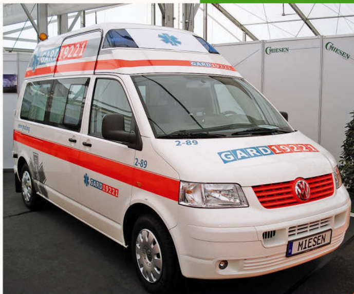
Ambulance VW T5 rehaussée