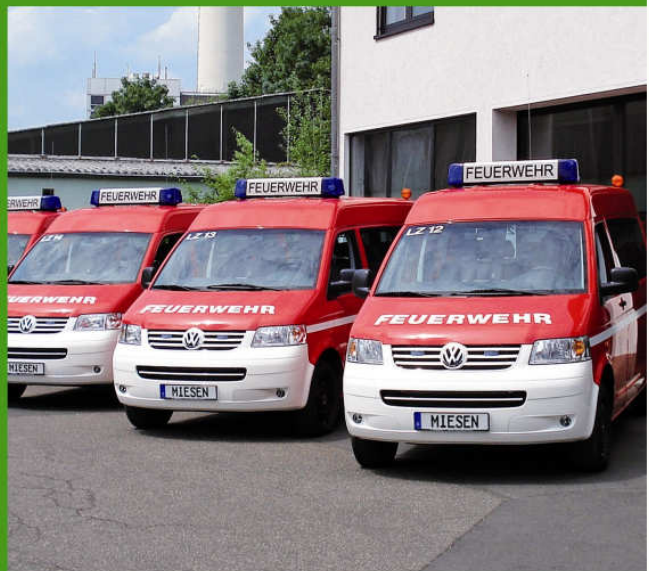
Ambulance de rapatriement VW T5