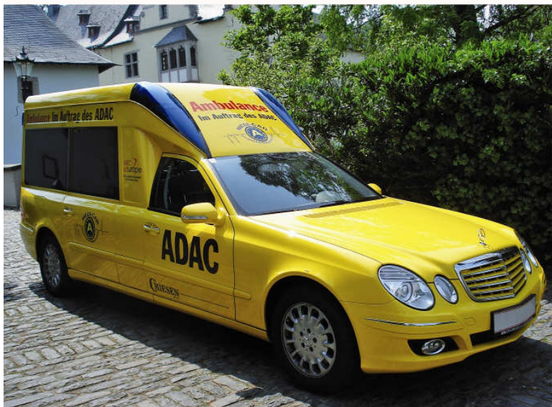
Ambulance BONNA 211 L