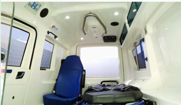
Einblicke in den Patientenraum

Cabinet for a vacuum mattress on left sidewall