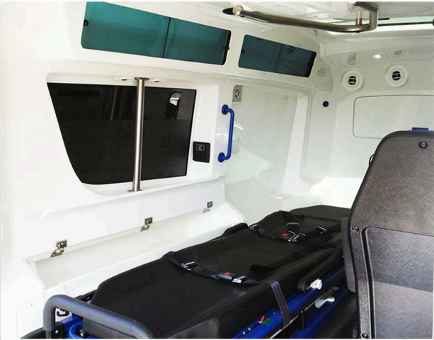
Vakuummatratzenschrank an linker Seitenwand

Cabinet for a vacuum mattress on left sidewall